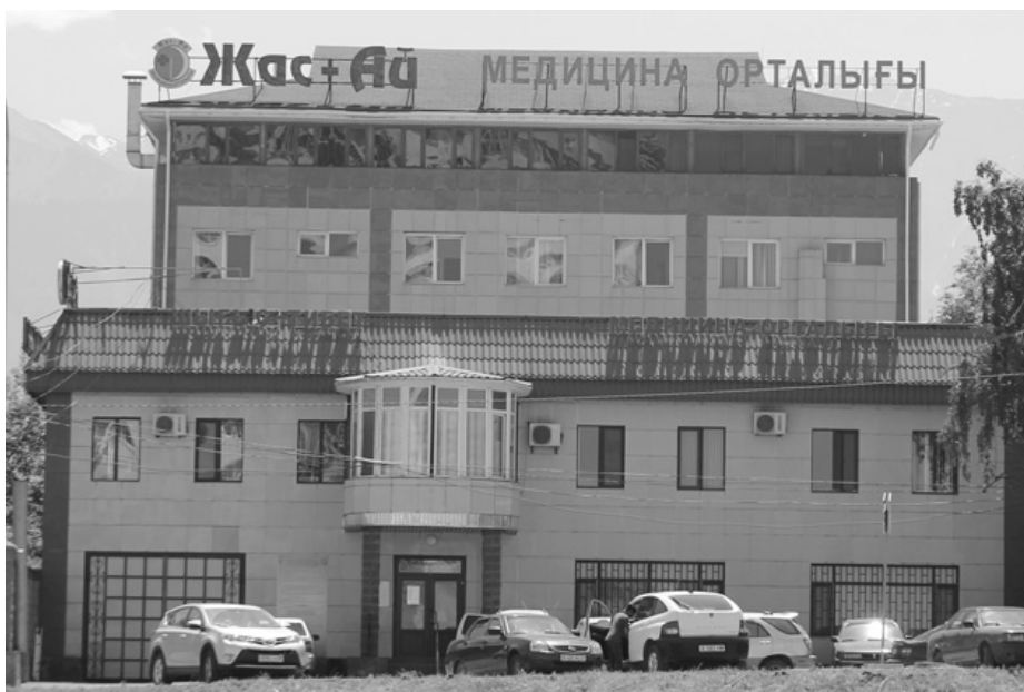
«Жас-Ай» медицина орталығының Алматыдағы ғимараты